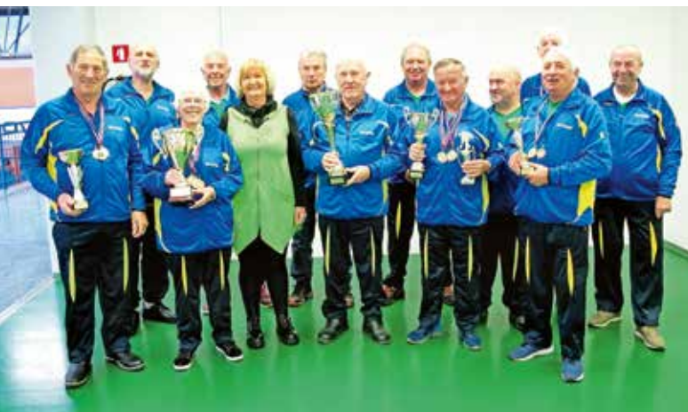
Tekmovalci z osvojenimi pokali in medaljami v sezoni 2021/22

Na tekmovanju za prvaka balinarske sekcije je nastopilo deset najboljših balinarjev. Zmagal je Marjan Bernard pred